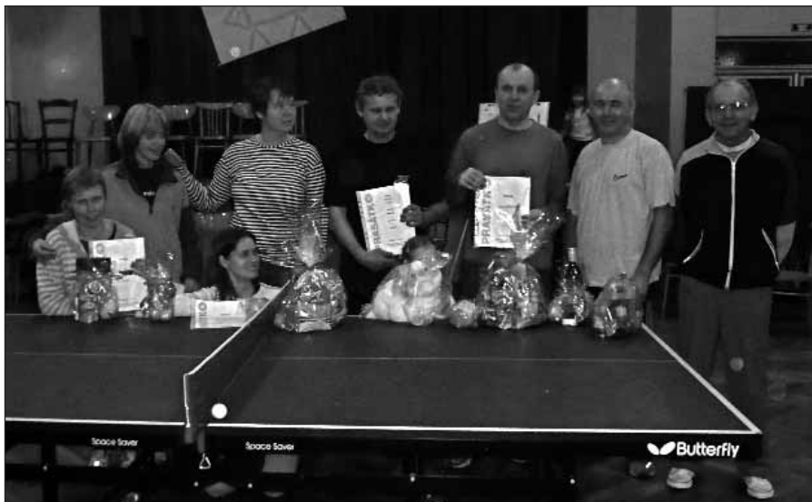
Společná fotografie vítězů a hráčů na 2. a 3. místech.

Zmínění pánové uspořádali na jednu listopadovou sobotu ve vyhlášené sportovní hale U Stupárků turnaj ve stolním tenise, pro poučené s pochopitelným názvem „PRASÁTKO“ (neboli obtížně chytatelný čili nečistý míč s dotykem