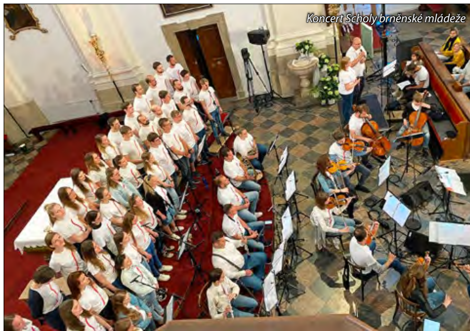
Koncert Scholy brněnské mládeže