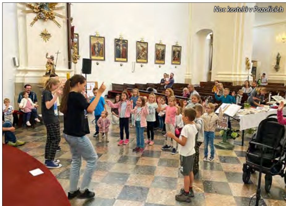
Noc kostelů v Pozořicích