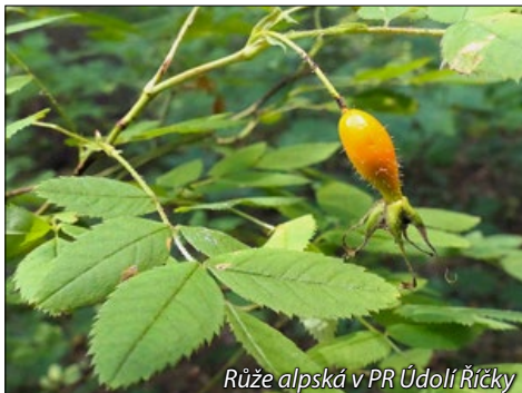
Růže alpská v PR Údolí Říčky

V okolí Hostěnic rostou i dva ohrožené druhy drobných planých růží. Oba dva jsou naopak teplomilné a pro jižní Moravu typické. Na úbočí Hádů, v Sivickém lese nebo v rekultivované části Mokerského lomu najdeme naši nejnižší růži, která jen málokdy vyroste výše než do půlmetru a spíše se jen tak plazí po zemi. Ze všech planých evropských růží má přitom největší květy. Jmenuje se Růže galská ( Rosa gallica ) a je to nádhera, když se její tmavě růžové květy rozsvítí v červnu nízoučko nad zemí. Areál jejího rozšíření se z velké části překrývá s oblastí dávného keltského