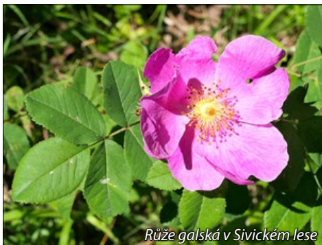
Růže galská v Sivickém lese