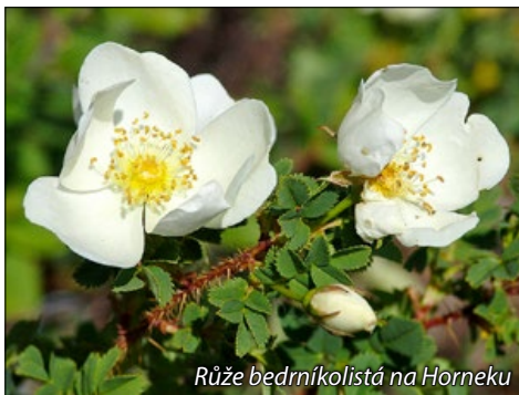
Růže bedníkolistá na Horneku